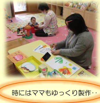
時にはママもゆっくり製作..