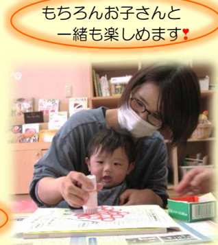
もちろんお子さんと一緒に楽しめます♡