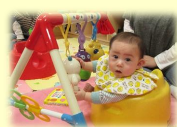
好きな遊びが楽しめますよ♡