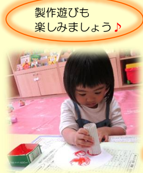
製作遊びも楽しみましょう♪