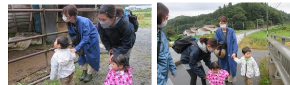
~わんぱくの森に遊びに行こう！~

福栄保育園のお友達と一緒に散策をして、いろんな事をたくさん教えてもらいました！！