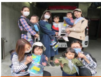
~保育園のお友達とお散歩会~

福栄保育園のお友達と一緒に散策をして、いろんな事をたくさん教えてもらいました！！